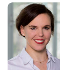
Angelika Hofhansl Teaching Center

Tel.: +43 (0)1 40160-36711 angelika.hofhansl@meduniwien.ac.at